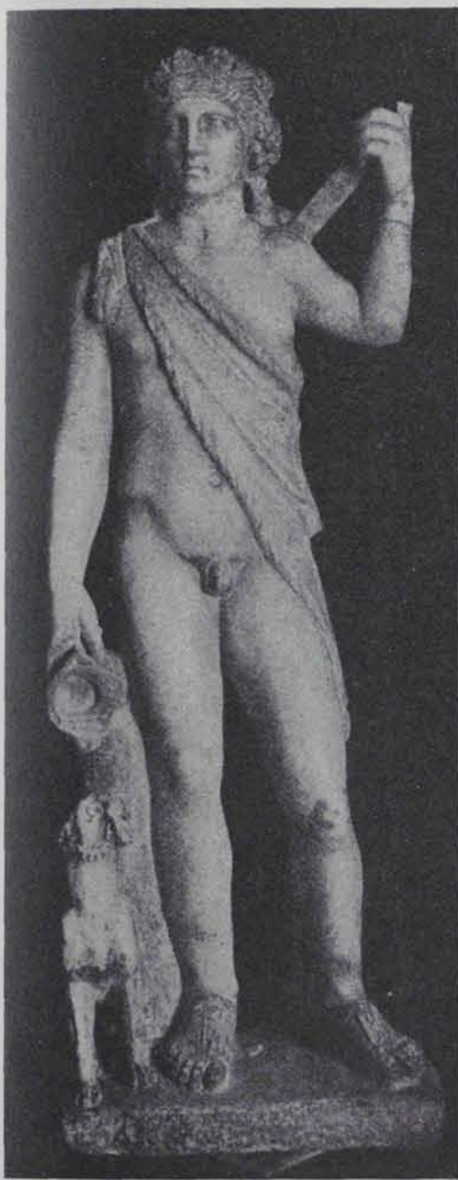
Fig. 174.—Estàtua de Bacchus. Marbre romà descobert a València (Gravats de la «Gasetta de les Arts»)

L'estàtua representa una figura de dona: sembla d'una joveneta vestida amb una túnica que forma un plec sobre la cintura i, a més, amb un ampli mantell caigut, recollit sobre el braç dret i anusat sobre la cuixa esquerra, deixant visible tot el tors i ambdues espatlles. Falten el cap, tot el braç esquerre i la part inferior de les cames. El braç dret sosté un objecte que està cobert