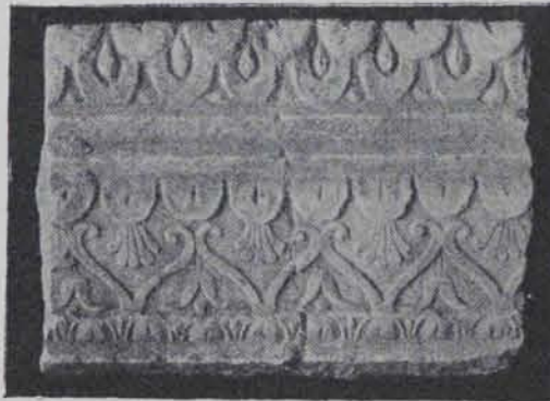
Fig. 184 Fragment de fris de marbre. 0'30 ctms. llarg (Gravats de la «Gasetta de les Arts»)