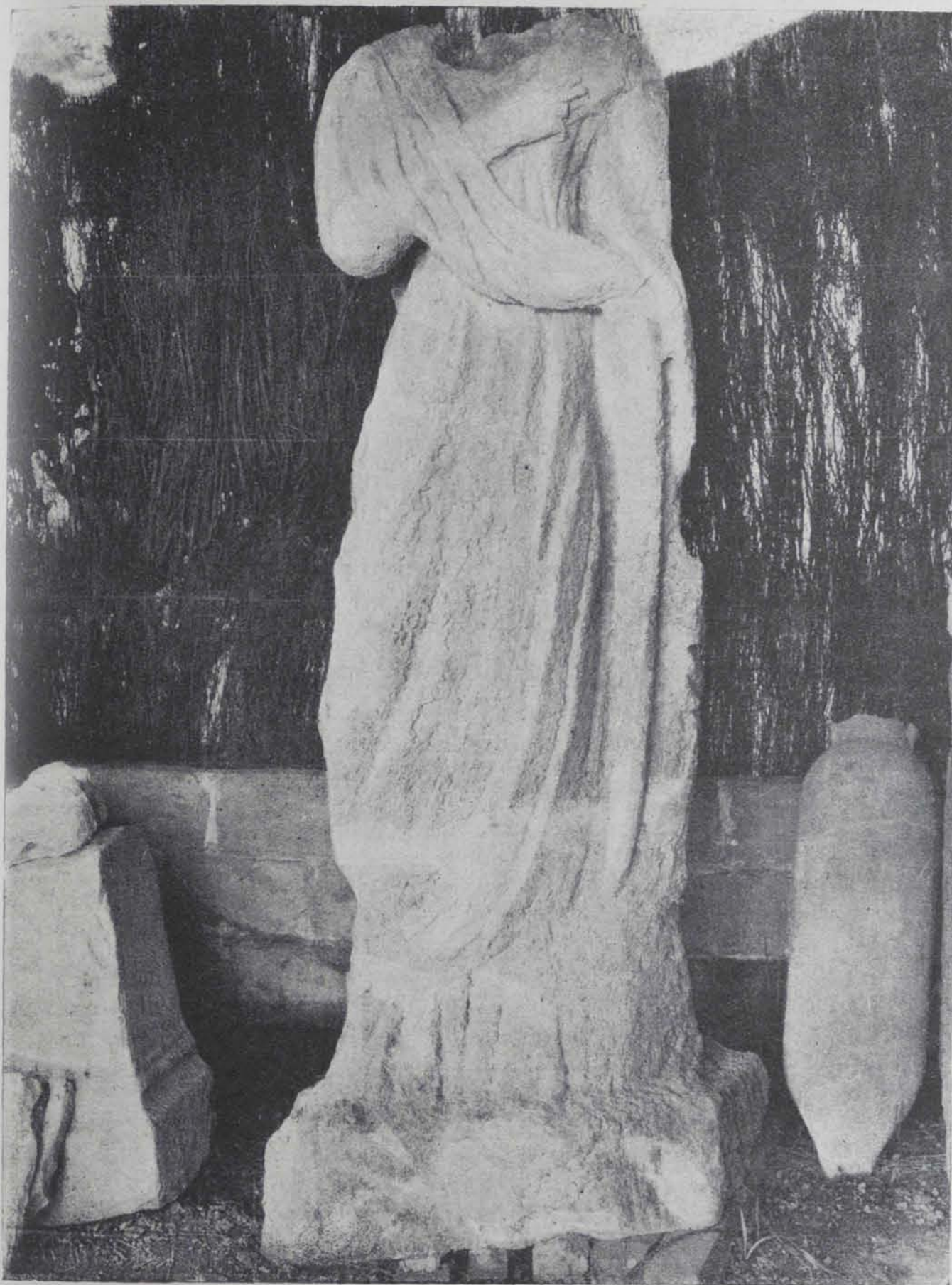
Fig. 176. — Estàtua femenina de pedra policromada. 1'65 cims. alt (Gravat de la «Gasetà de les Arts»)