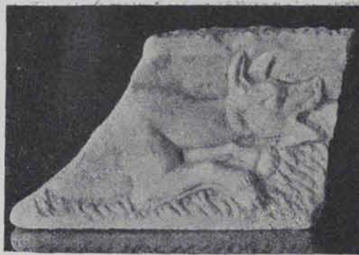
Fig. 178.—Baix relleu de marbre. 0'35 ctms. llarg