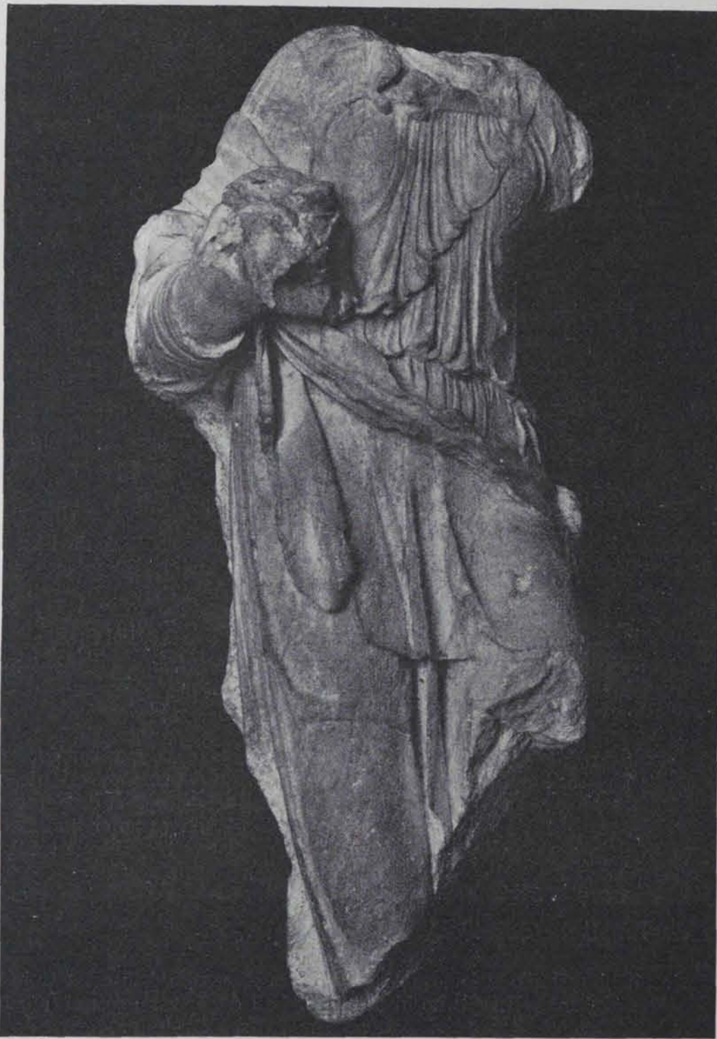
Fig. 172. — Marbre antic trobat a Tarragona (Museu de la Ciutadella) (Gravat de la «Gasete de les Arts». — Fot. Laboratori del Museu)

A fi de completar l'inventari de l'estatuària del Conventus Tarraconensis , fet per M. Eugène Albertini (1), publiquem a continuació les obres descobertes durant el període a que fa referència el nostre ANUARI, fent d'elles, més que un estudi, una descripció sumària.