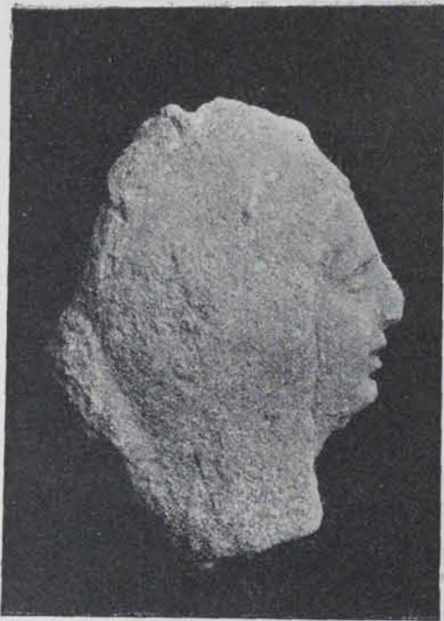
Fig. 177.—Testa de pedra. 0'30 ctms. alt