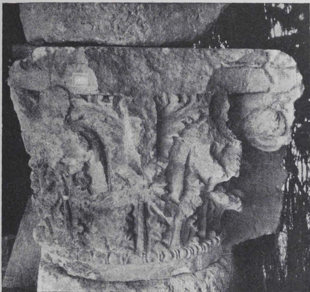
Fig. 186. — Capitell corinti de pedra. 0'40 ctms. alt

Antefix de pedra del país que sembla havia estat policromat; els llavis molt sortints i el nas ample i aixafat li donen una expressió ridícula (fig. 180).