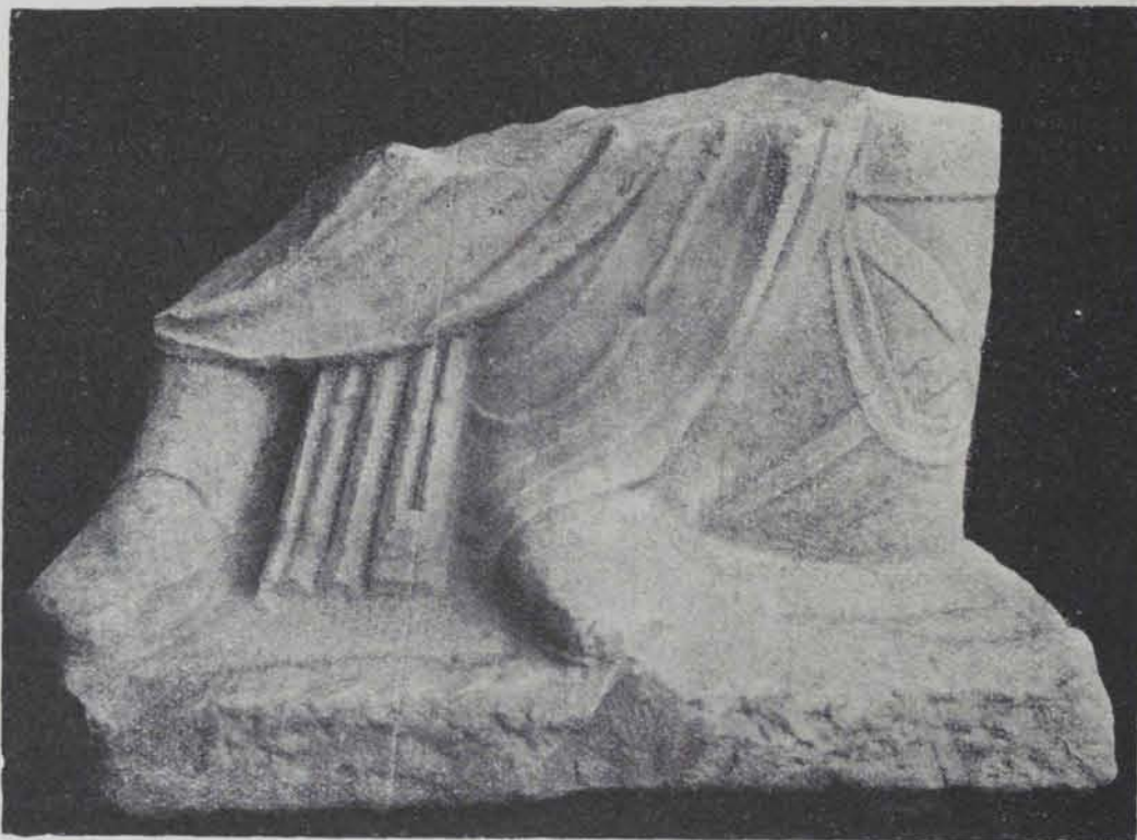
Fig. 175. — Part inferior d'una estàtua masculina de marbre blanc. Tamany natural

És la representació d'un Bacchus jove nu i la pell de boc nuada a l'espatlla dreta; té a la mà dreta un cànthar, i l'esquerra, unida encara a l'espatlla per un fragment de marbre, aguantava el thirse. Un ca amb el coll guarnit d'un collar està assegut al costat dret.