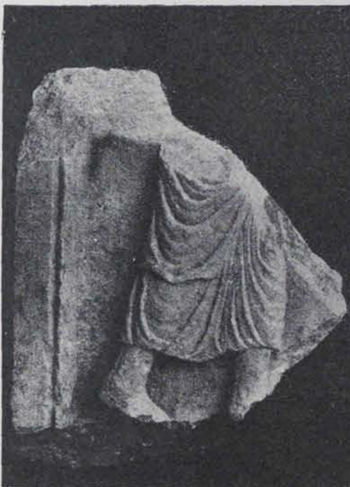
Fig. 183.—Baix relleu de marbre. 0'40 ctms. alt