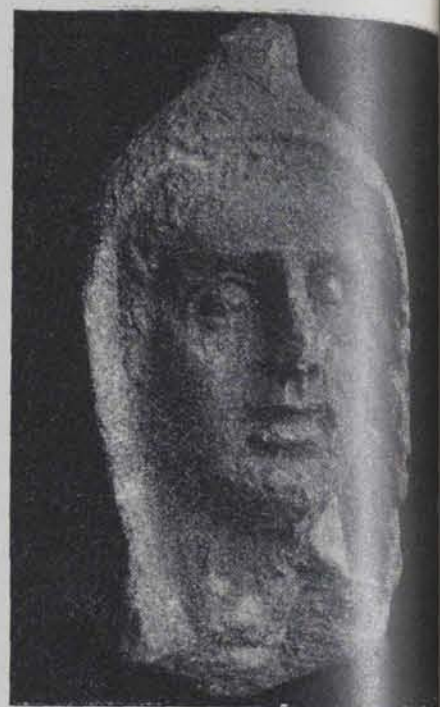
Fig. 179.—Testa de pedra. 0'35 ctms. alt (Cl. Mas)