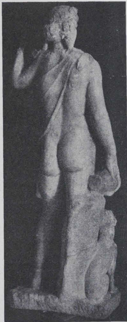
Fig. 173.—Estàtua de Bacchus. Marbre romà descobert a València

pels plecs del mantell i que, per estar trencat, no es pot saber què és. A l'espatlla hi ha la representació d'un buirac indicat en sil·lueta. L'estàtua devia d'anar dintre un fornàcul o junt a un mur i el seu darrera restava invisible. Tot fa pensar en una estàtua d'Artemisa.