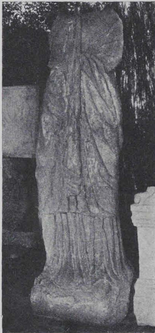
Fig. 181.—Estàtua femenina de pedra policromada. 1'70 ctms. alt