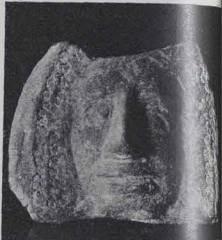
Fig. 182.—Antefix de pedra. 0'25 ctms. alt (Cl. Mas)