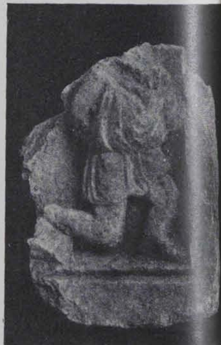
Fig. 185.—Baix relleu de marbre. 0'25 ctms. alt